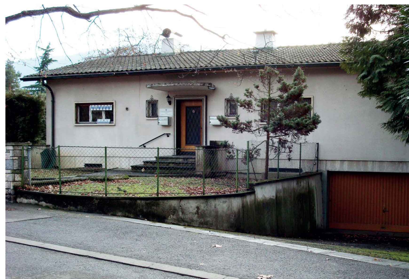
Ancienne parcelle privée construite

Notre histoire s'inscrit aussi dans nos paysages. Alliant conservation de la nature et préservation de la mémoire locale, Thônex a décidé de rétablir sur une parcelle voisine de la mairie le verger qui s'y épanouissait il n'y pas si longtemps. Sur 1'315m 2 , de nombreuses variétés de pommes, parfois très anciennes, toujours délicieuses, vont s'enraciner pour faire revivre une biodiversité oubliée. Cet espace gourmand sera enrichi d'une haie fruitière, d'un étang et d'un jardin de plantes médicinales. De quoi accueillir de nombreux ateliers, et perpétuer des savoirs ancestraux, des plus en plus d'actualité.