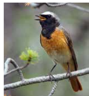
De gauche à droite et de haut en bas : Choucas des tours, Mésange charbonnière, Sitelle torchepot, Rougequeue à front blanc.