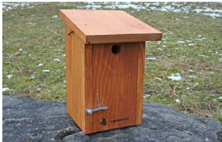
Niohoirs pour cavernicoles