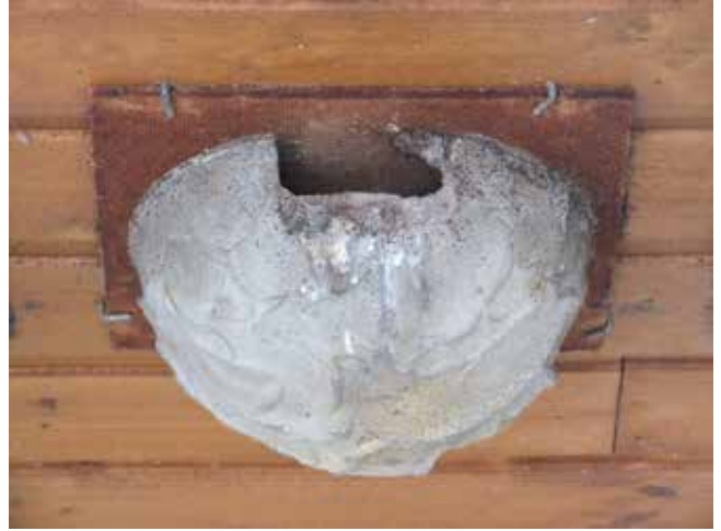
Nichoir pour hirondelles de fenêtre

Construire ses nichoirs ( www.birdlife.ch ).