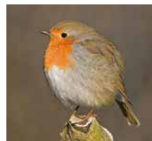
De gauche à droite et de haut en bas : bergeronnette grise, rougequeue noir, gobemouche gris, rougegorge familier.