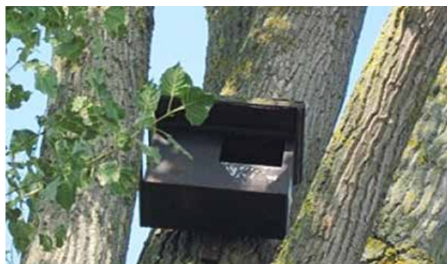
Niochir pour faucons crécerelles