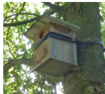
Niohoir pour cavernicoles au Parc Beaulieu à Genève