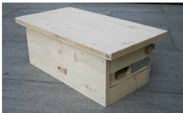
Nichoir pour martinets